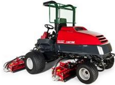
Skyddsnät på maskiner