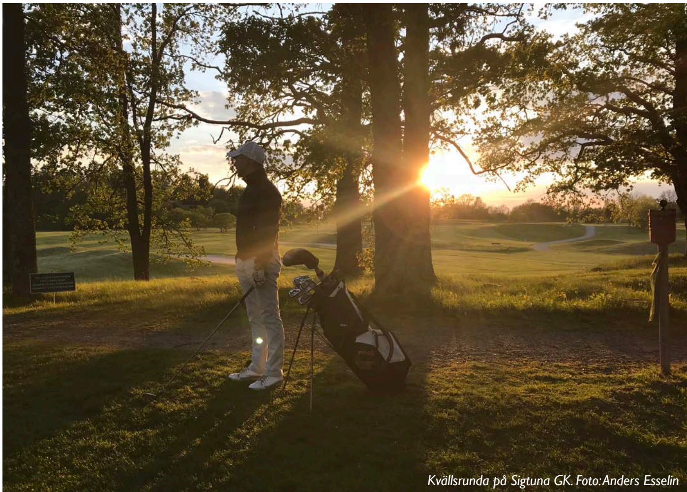
Kvällsrunda på Sigtuna GK.