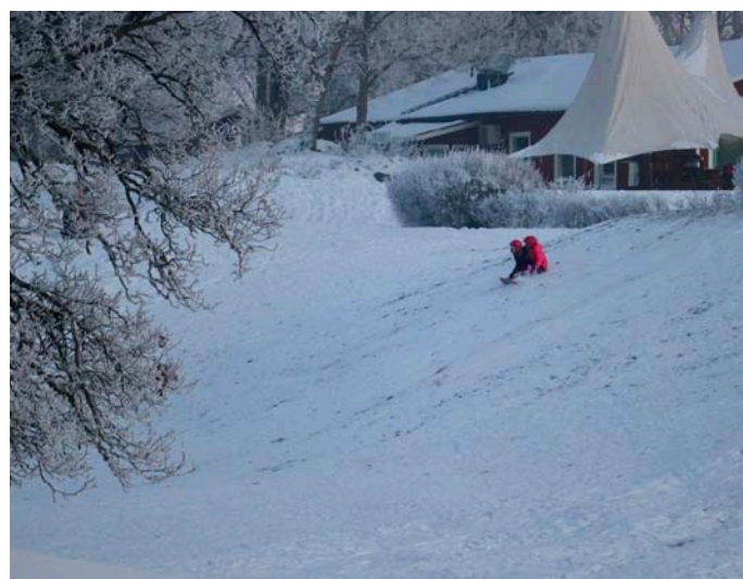
Pulkabacke på Sigtuna GK.