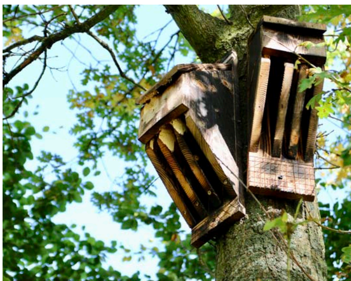
Fladdermusholkar på Asserbo GK, Danmark.