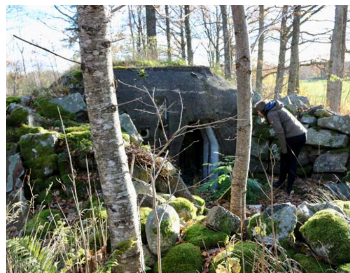
En tysk bunker från andra världskriget på Larvik GK, Norge.