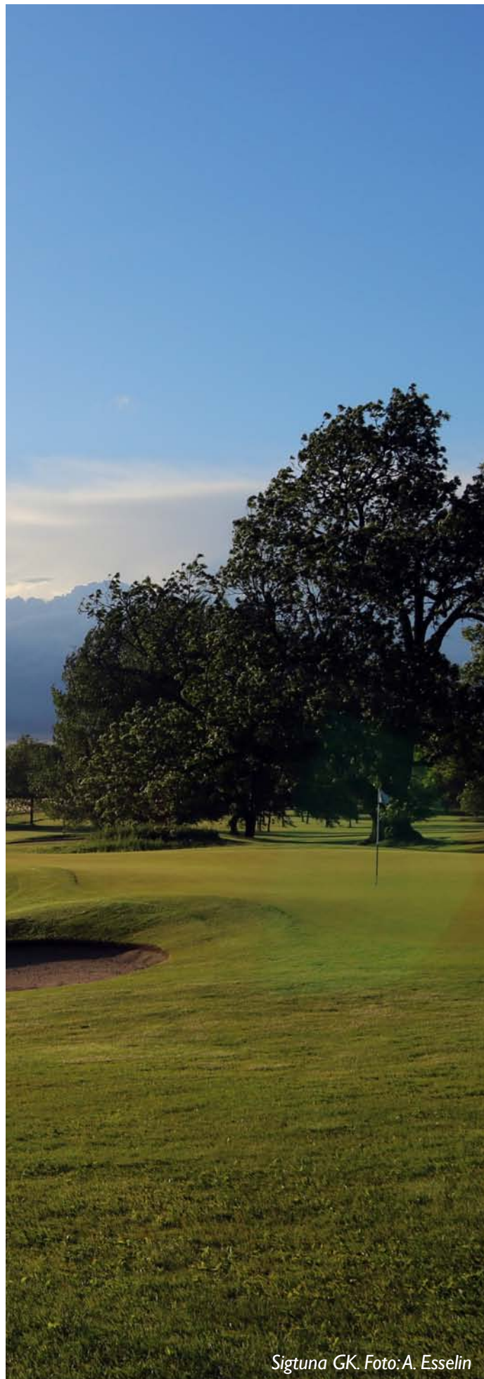
Sigtuna GK.