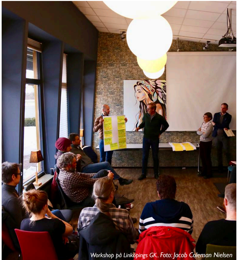
Workshop på Linköpings GK..