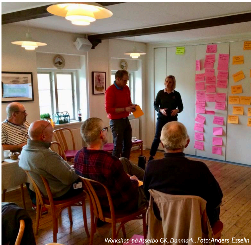
Workshop på Asserbo GK, Danmark..