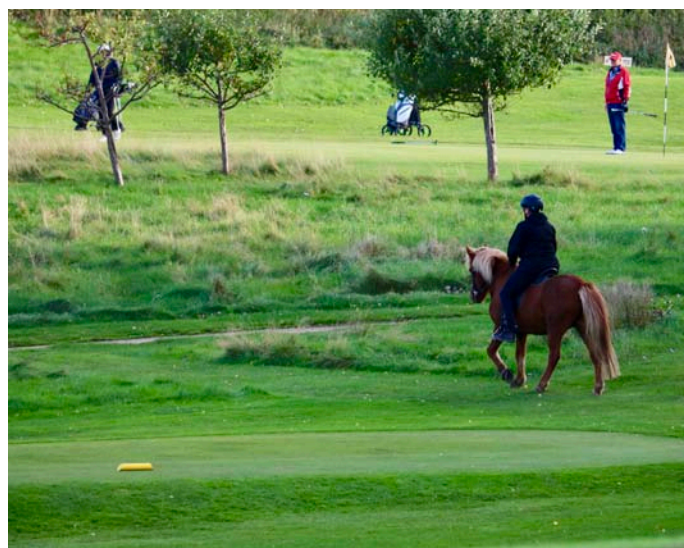
Ridning på säkra stigar på golfanläggningen. Asserbo GK, Danmark.