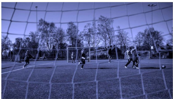
SvFF agerar efter beslut om tak i RF-stödet