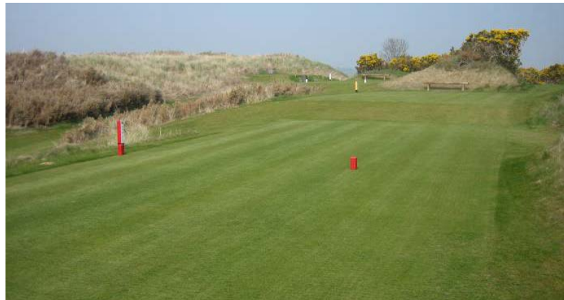
Royal County Down, Nord Irland